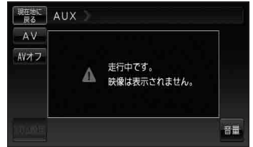
AUXモード画面(走行中)(例)

お知らせ 本機を車(12V車)のバッテリー(付属のシガーライターコード(12V車対応))で使う場合は、安全上の配慮から車を完全に停止し、パーキングブレーキをかけた場合のみ映像をご覧になります。(走行中は音声のみになります。)