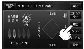
(例)エコドライブ情報画面