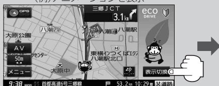
(例) アニメーションを表示