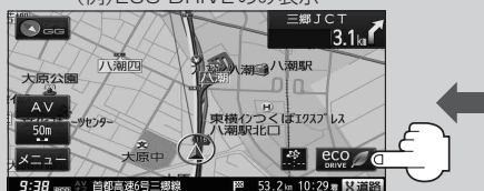
(例) ECO DRIVE のみ表示