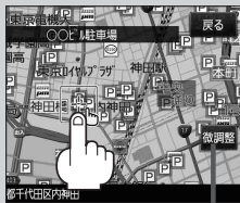
微調整 ボタン [?] B-21