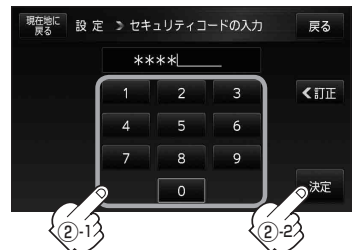
セキュリティコード入力画面