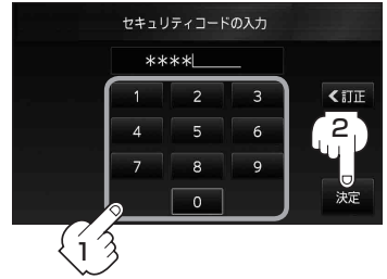
セキュリティコード入力画面

※メッセージが表示された場合は、メッセージを確認し OK をタッチしてください。