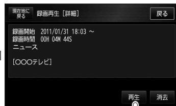
(例) 録画再生詳細画面