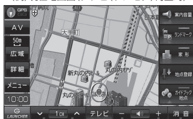
(例) 現在地画面(テレビ(ワンセグ)再生時)