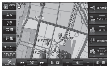
(例) 現在地画面(動画再生時)