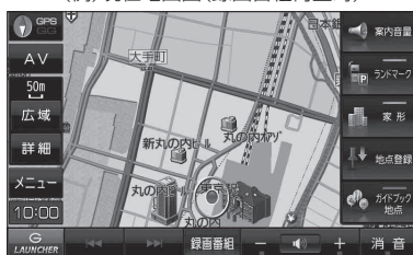
(例) 現在地画面(録画番組再生時)