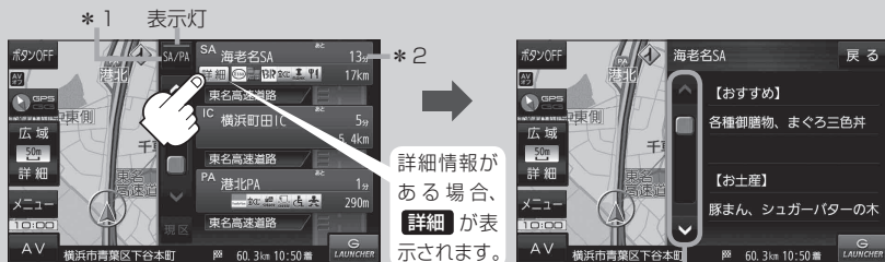
情報の続きを表示