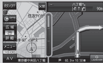
(例)交差点拡大表示