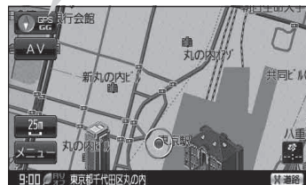
(例) 現在地表示画面