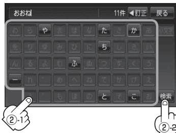
地名50音検索入力画面*2