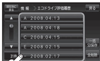
(例)エコドライブ評価履歴画面

リストから見たい日時の履歴を選んでタッチする。 ：エコドライブ評価履歴の詳細画面が表示されます。