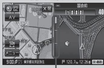
(例) 交差点拡大表示

・ データは地図ソフト作成時のものであるため、表示された内容(ランドマークなど)が実際とは異なる場合がありますので、ご注意ください。