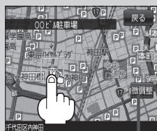
微調整 ボタン B-20