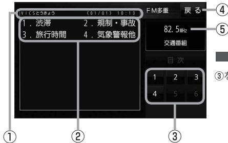
(例)文字表示(レベル1)目次画面