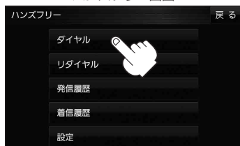
ハンズフリー画面