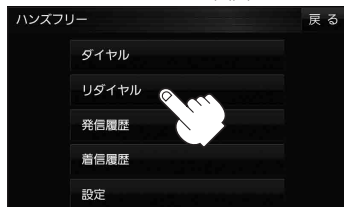
ハンズフリー画面

: メッセージが表示され はい をタッチすると、 前回発信した相手にリダイヤルします。