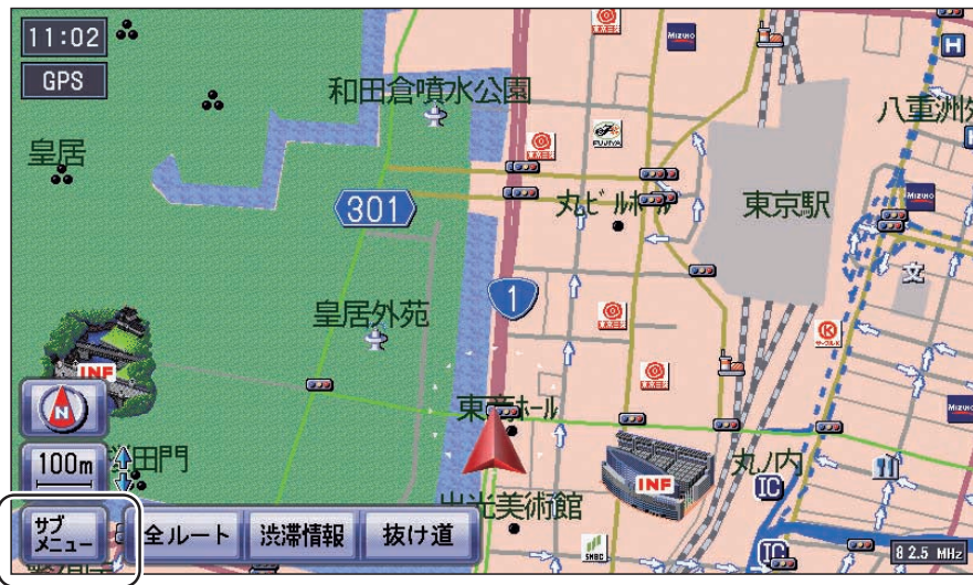
現在地画面表示中は