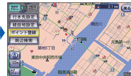
地図モード画面表示中は