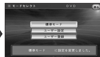
■ AV設定一覧表：①～⑤は、ユーザー登録の内容をご記入ください。