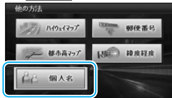
他の方法で探す (10ページ)