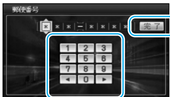
地図が表示されます。