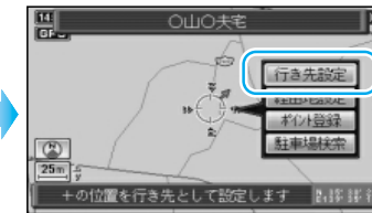
ルート探索を開始します。