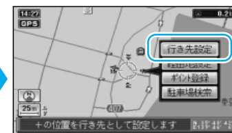
ルート探索を開始します。