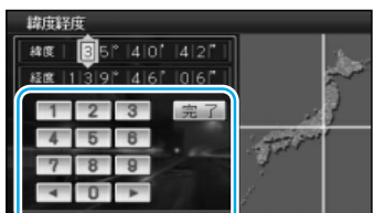
地図が表示されます。