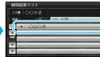
地図が表示されます。名称が多い場合は、 エリア を選ぶと、名称を絞り込めます。