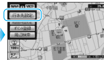
ルート探索を開始します。