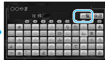
10キーでも文字入力できます。