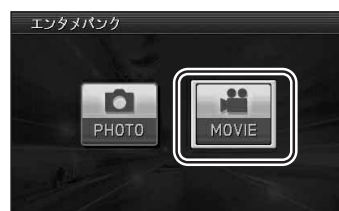
(エンタメバンク画面)