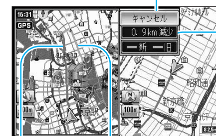
変更後のルート 変更前のルート