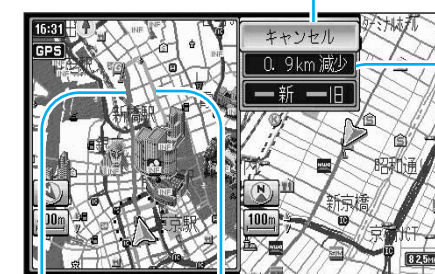
変更後のルート 変更前のルート