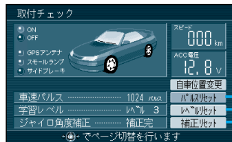
取り付けチェック画面