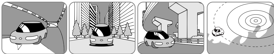
トンネルの中 高層ビルなどの間 高架道路の下 サービスエリア外

FM多重の場合、一定周期で情報が更新されるので表示するデータが揃うのに時間がかかる場合があります。(約3分)