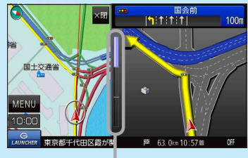
(例)交差点拡大表示