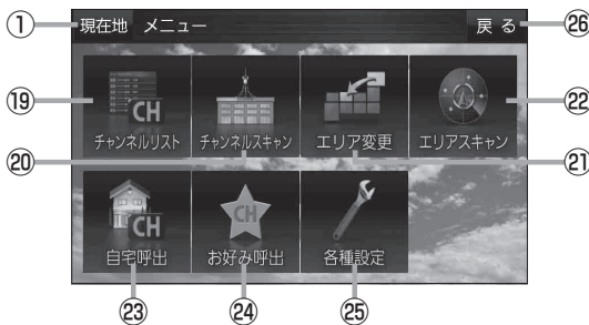
(例)TV(ワンセグ)メニュー画面 ⑦をタッチして表示