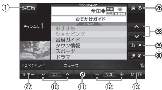
(例)データ放送画面 ⑪をタッチして表示