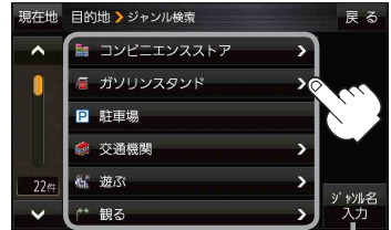
ジャンル名入力 ボタン