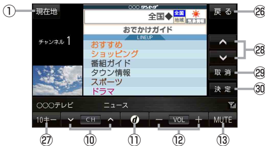
(例)データ放送画面 ⑪をタッチして表示