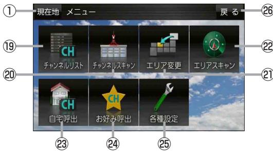
(例)TV(ワンセグ)メニュー画面 ⑦をタッチして表示