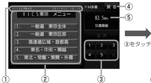
(例)図形表示(レベル2)目次画面