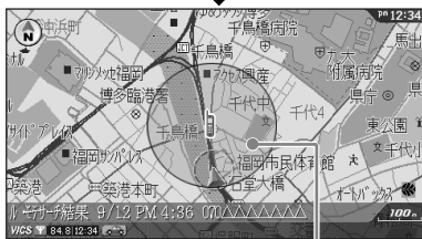
相手の位置範囲 (紫色の円内)