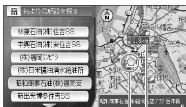
ランドマークを表示