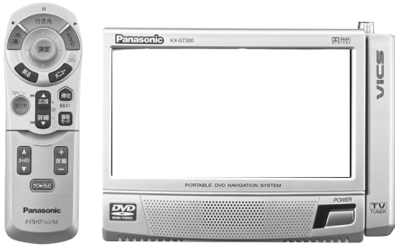
KX-GT300V (FM-VICS内蔵テレビチューナー付)