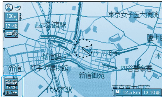
タイムスタンプ/チューナーマーク