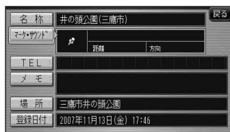
(登録ポイント情報画面)