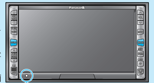
ハードリセットスイッチ 折れにくい棒状の物で、まっすぐに押してください。