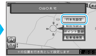
ルート探索を開始します。