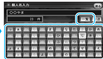
10キーでも文字入力できます。