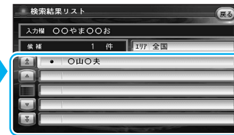
地図が表示されます。