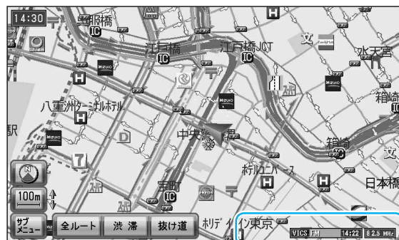
タイムスタンプ/チューナーマーク