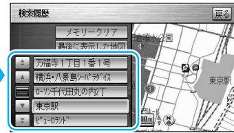
地図が表示されます。