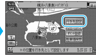
ルート探索を開始します。