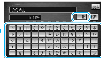
10キーでも文字入力できます。