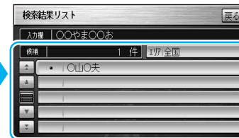
地図が表示されます。名称が多い場合は、 エリア を選ぶと、名称を絞り込めます。