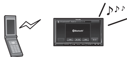
Bluetooth® 対応機器 (携帯電話など)

Bluetooth® 対応の携帯電話やオーディオ機器と組み合わせると、本機からそれらの機器を操作して再生できます。(Bluetooth® Audioの操作については166ページをご覧ください。)