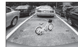
(カメラの映像を表示)