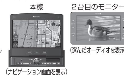
(ナビゲーション画面を表示)