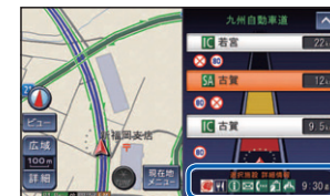
選択施設詳細情報