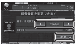
(録音音質設定画面)

2 録音音質設定自動表示 (P.91) を「する」に設定時のみ、録音音質設定画面が表示されます。