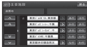
検索結果画面(例:主要施設)