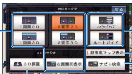
地図表示変更メニュー