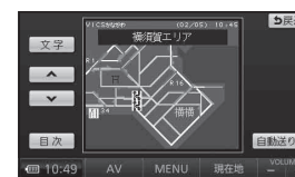
図形表示型 (レベル 2)