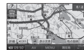
地図表示型 (レベル 3)