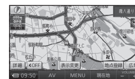
地図表示型 (レベル3)