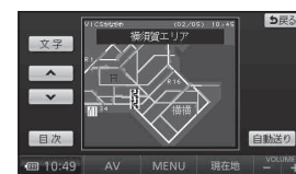
図形表示型 (レベル2)