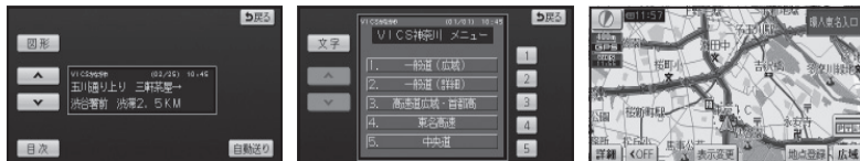
文字表示型 (レベル1) 図形表示型 (レベル2) 地図表示型 (レベル3)