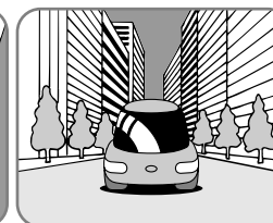
高層ビルなどの間