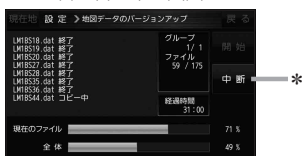
書き替え中の画面

*印…地図データの書き替え中に「中断」をタッチした場合、「開始」→「はい」をタッチして地図の書き替えを再開してください。