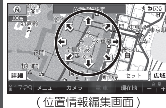
(位置情報編集画面)