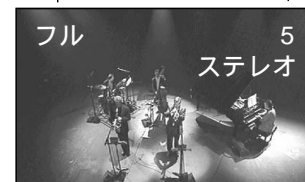
ディスプレイ上の表示

音声の種類 受信中の音声 (ステレオ、モノ、主/副音声) を表示 (14 ページ)