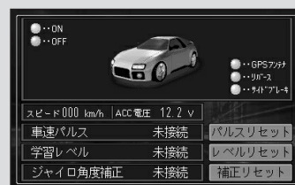
車両信号情報画面